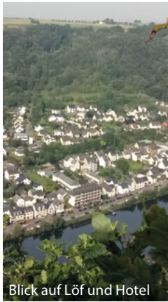
Blick auf Löff und Hotel

Anstelle der für Juli 2021 geplanten Wanderwoche „Alpenüberquerung“ ging es an einem sonnigen Sonntag im September für elf Frauen in PKW-Fahrgemeinschaften aus Celle Richtung Moseltal nach Löff bei Koblenz. Dort bezogen wir unser Standquartier, ein stark frequentiertes, recht komfortables Hotel, direkt am Flussufer gelegen.