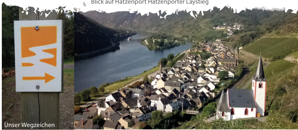
Blick auf Hatzenport Hatzenporter Laystieg

Die nächste Wanderung verlief über den Bergschluchtenpfad auf der Hunsrückseite.