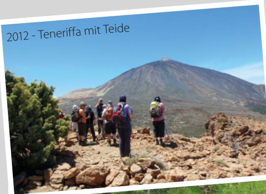
2012 - Teneriffa mit Teide