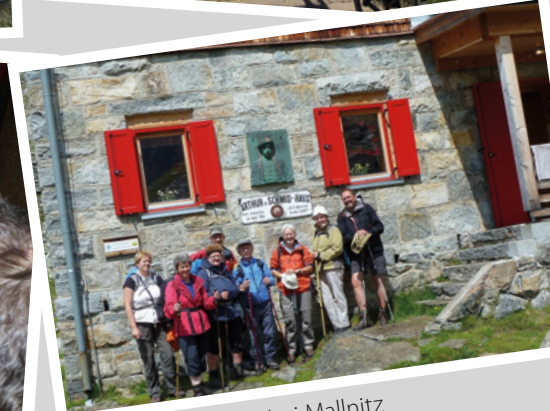
2014 - Wanderung bei Mallnitz