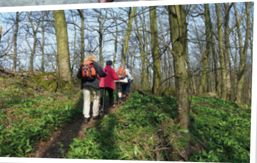
2012 - Frühjahrswanderung im Ith