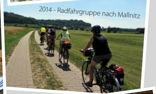
2014 - Radfahrgruppe nach Mallnitz