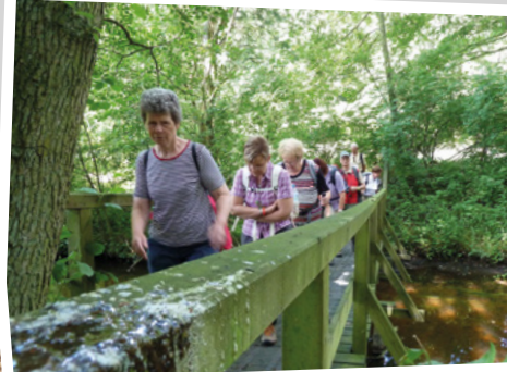
2014 - auf dem Flusserlebnispfad