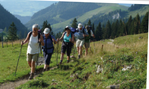
2011 - auf dem Weg zum Geigelstein