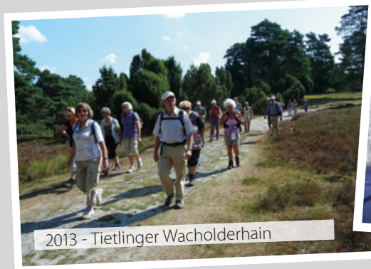
2013 - Tietlinger Wacholderhain