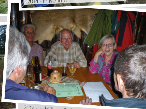
2014 - Jubiläum Celler Hütte