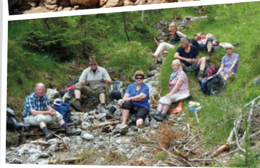
2013 - auf dem Lechweg