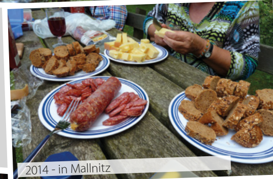
2014 - in Mallnitz