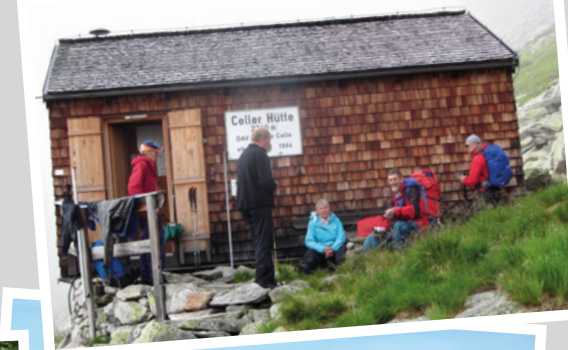
2014 - Jubiläum Celler Hütte