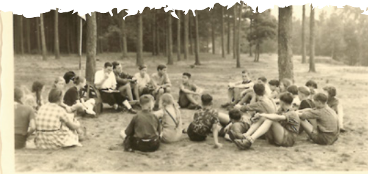
Am Sonntag morgen bei der zweiten Lesung der Satzungen.

Die Gruppe traf sich in der "S a n d k i s t e" hinter den Sportplätzen. Die erste Fahrt nach Hermannsburg wurde besprochen. Ein Völkerballspiel beendete den Nachmittag.